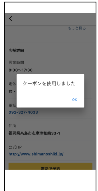
クーポン使用後の画面